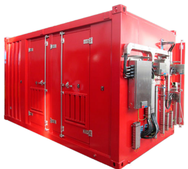
Carcasa de contenedor del Ultra Fog para unidades de acumulador en zonas peligrosas