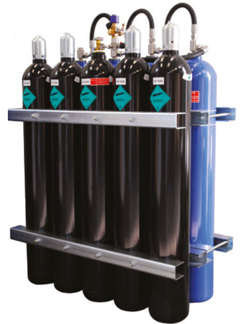
Acumuladores del Ultra Fog

Los sistemas de extinción de incendios marinos y en alta mar Ultra Fog están diseñados para salvar vidas y la propiedad. Por eso es tan importante que los sistemas funcionen con eficacia y fiabilidad. Nuestro objetivo es diseñar, suministrar e instalar sistemas de la mayor calidad y funcionalidad posibles, y prestar un servicio que supere las expectativas.