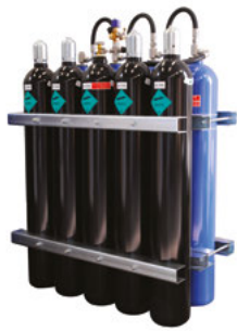
ACUMULADORES DEL ULTRA FOG