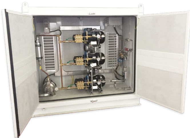
Unidad de microbomba y sistema MPU 335 con una gabinete específico