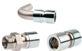
ROHRLEITUNGEN UND FITTINGS